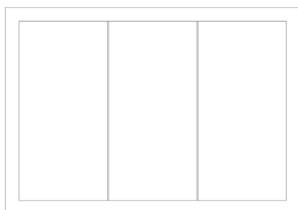
Cloison bord-à-bord en ligne